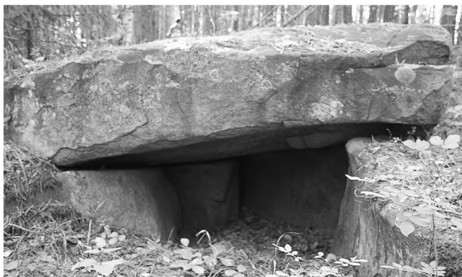
Рис. 2-1. Мегалитические памятники. Вид Шитовского 6 до раскопок