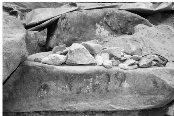
Рис. 2-3. Мегалитические памятники. Слой гумуса под западной плитой дворика