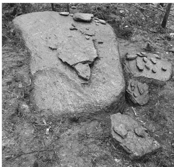
Рис. 2-4. Мегалитические памятники. Мастерская