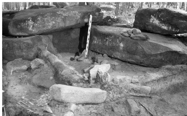
Рис. 2-2. Мегалитические памятники. Площадка-дворик на 2 уровне проведения обряда