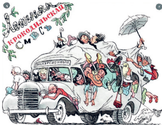
Рис. 9. «В нашем доме отдыха так тесно, что здесь я просто отдыхаю». Рис. И. Семенова [Летняя крокодильская смесь 1952: 13.]

Визуализация маргинальных форм досуга советских граждан, как правило, получает рассмотрение в форме карикатурных сюжетов. На страницах «Крокодила», в газетах различного уровня, в сатирическом киножурнале «Фитиль» отражались пороки советского социума, список которых являлся фактически неизменным в рамках исследуемого периода: бюрократизм, «очковтирательство»,