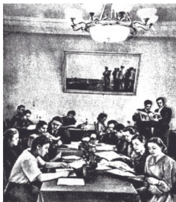
Рис. 4. На снимке: читальный зал. Здесь спокойно работают с книгой, газетой и журналом в часы досуга рабочие, инженерно-технические работники и служащие завода им. Кирова [Читальный зал 1954: 2]