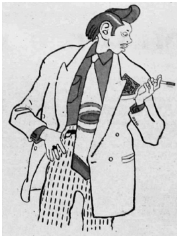
Рис. 10. [Тимофеев 1953: 5].

В другом сюжете описана практика поедания макарон на скорость без помощи рук, зафиксированная в ресторанах США (текст сопровождают фотоиллюстрации американок с перепачканными лицами) [Королева макарон 1949: 2].