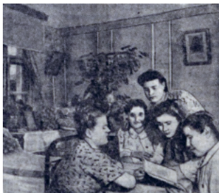
Рис. 2. Весело и интересно проводят свой досуг девушки-штукатуры участка Жилстрой, проживающие в общежитии № 33 стройуправления Уралтяжтрестрой [По нашему городу 1950: 1]

Более широко на страницах послевоенной советской прессы популяризировались «культурные» формы отдыха советских трудящихся вне дома. Значительной востребованностью СМИ характеризовались фотосюжеты, запечатлевшие советских граждан в библиотеках и читальных залах (рис. 4). Как правило, на данных фото изображались группы людей (5–15 человек), что должно было подчеркнуть распространенность практики чтения в советском социуме: «Уютно в читальном зале клуба им. Ленина в Первоуральске. По вечерам здесь многолюдно. Работницы, рабочие, служащие собираются сюда, чтобы почитать свежие газеты, журналы, книжные новинки» [Уютно в читальном зале... 1953: 3].