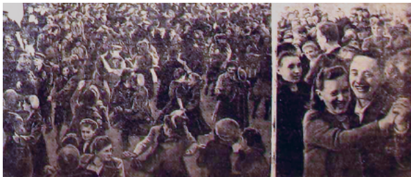
Рис. 8. Народное гулянье на площади 1905 года в Свердловске в День Победы. Фото М. Просвирина, И. Шубина [Советский народ празднует... 1946: 1]