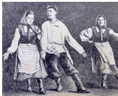
Рис. 5. Выступление художественной самодеятельности на эстраде городского парка. [Это идет молодежь 1956: 4]

Практика отдыха горожан в выходной день получила рассмотрение на страницах послевоенной прессы. В 1952 г. в одном из номеров журнала «Крокодил» была помещена подборка статей, объединенных темой: «Куда пойти в выходной?». На данный вопрос авторы отвечают следующим образом: «Поначалу этот вопрос может показаться несколько странным. Мало ли где можно провести выходной день! Тенистые парки, нарядные водные станции, благоустроенные пляжи, шумные стадионы, уютные клубы – всё к услугам отдыхающих» [Максимов, Краев, Попов 1952: 5].