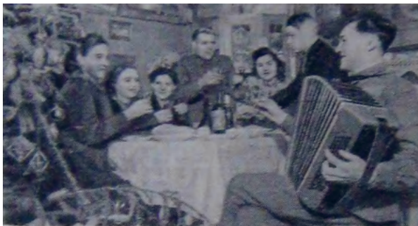
Рис. 7. Молодежь колхоза имени Ворошилова (Ухтомского района Московской области) на встрече Нового года [Новогоднее ... 1948: 9]

В газетах конца 1940-х – первой половины 1950-х годов образ празднующего Победу населения приобретает более организованные, «культурные» черты: «В эти дни значительно увеличился приток посетителей в Белорусский государственный музей истории Великой Отечественной