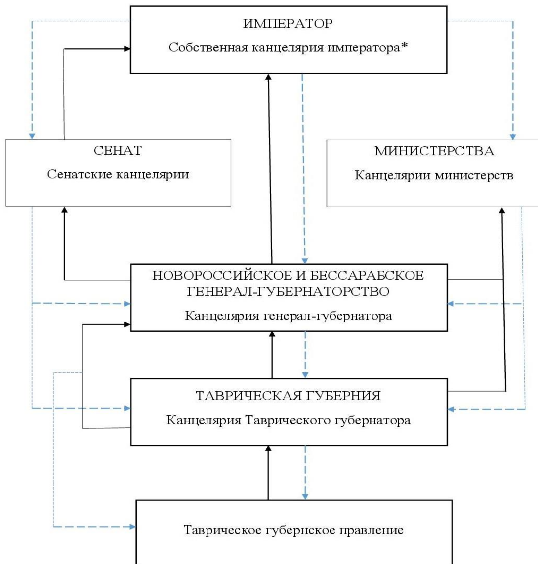
Рис. 2. Схема движения входящих и исходящих документов между учреждениями государственных органов управления разного уровня.