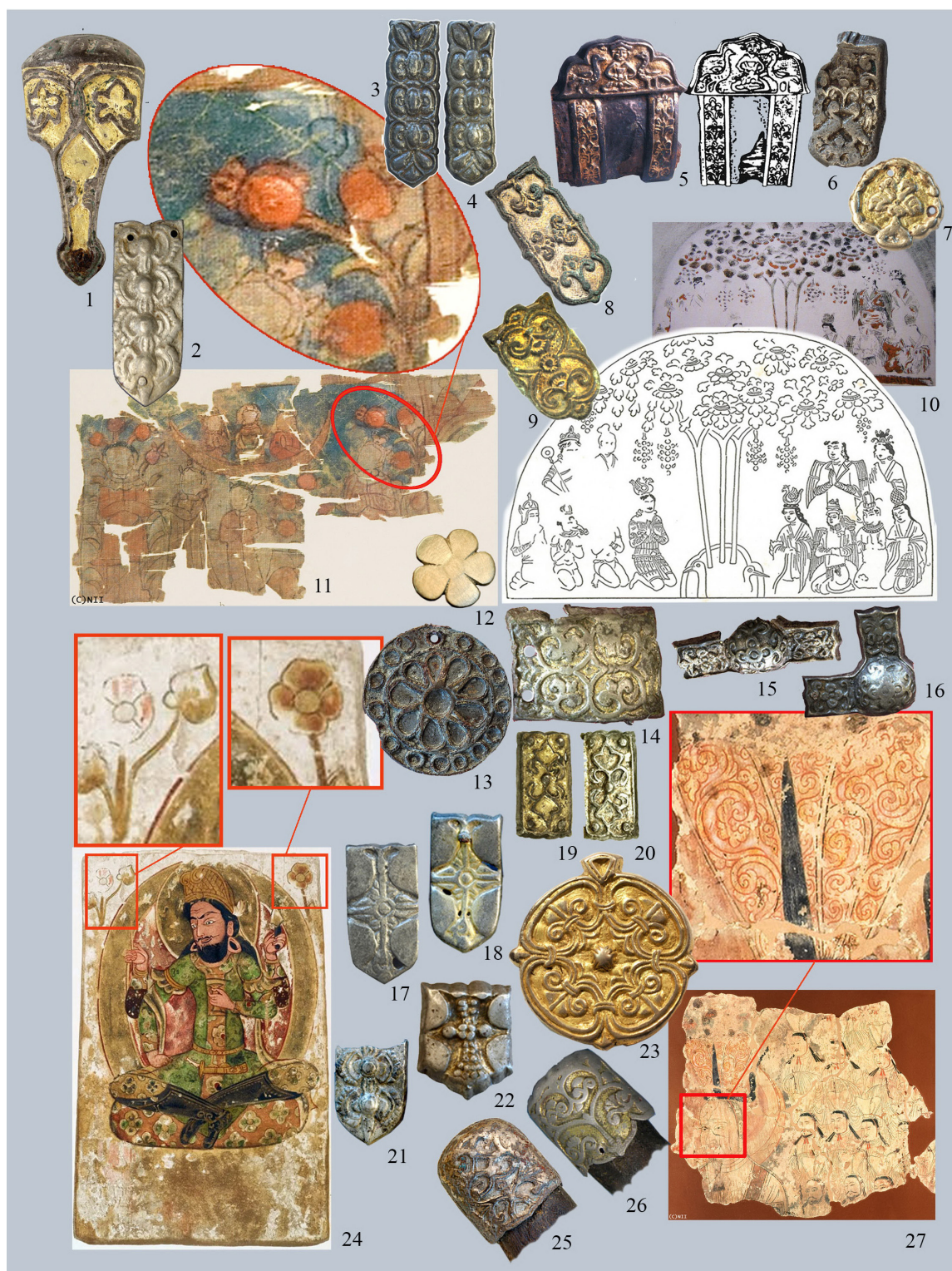
Рис. 2. Растительные сюжеты Древа жизни в манихейской живописной традиции и в торевтике сrostкинского населения урало-казахстанских степей.

1–4, 6–9, 14–16, 19, 20, 23, 25, 26 – Уелги, серебро с позолотой; 12, 13, 17, 18, 21, 22 – Уелги, серебро; 5 – Зевакинский могильник, курган 145; 10 – Безеклик (Турфан), пещера 25, «Царство Света ждет праведников» или «Поклонение Древу жизни в Царстве света» – подлинник и реконструкция; 11 – Гаочан, Цукимия (библиотека) Гаочан, роспись по шелку «Иисус в окружении людей под деревом жизни»; 24 – пещера «Тысяча Будд» г. Куча, фреска – уйгурский принц; 27 – Гаочан, настенная живопись «Мани в окружении благородных мужей»