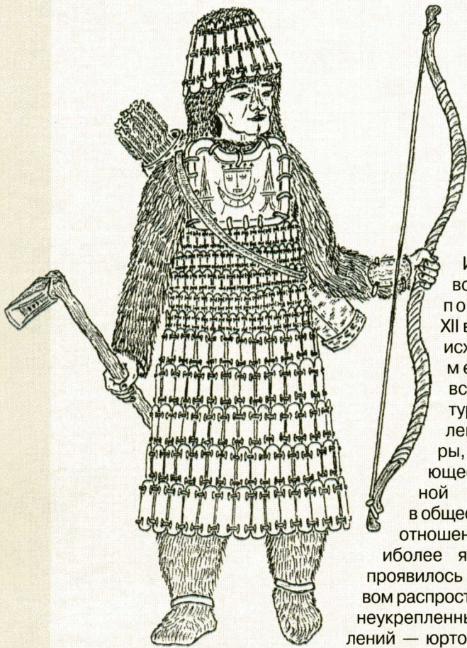
Западно-сибирский воин I в. до н. э. (Реконструкция выполнена по материалам раскопок городища Усть-Полуй в г. Салехарде).

Иногда археологи находят городища этого времени, стены которых разобраны, а рвы засыпаны. Это говорит прежде всего о том, что крупные территориальные объединения могли обеспечить своим подданным защиту от внешних врагов. С другой стороны, изменился и сам характер войн. Вместо межобщинных столкновений, когда победители изгоняли или уничтожали побежденных, войны «эпохи княжеств» велись в более «щадящем режиме»: князья-победители стремились захватить территорию вместе с ее населением, которое выплачивало бы регулярную дань.