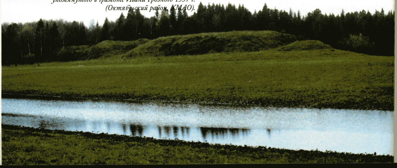
Городище Шеркалы I — остатки «города Соркорда», упомянутого в грамоте Ивана Грозного 1557 г. (Октябрьский район, КМАО).

Именно во второй половине XII века происходит изменение всей культуры населения Югры, отражающее коренной перелом в общественных отношениях. Наиболее ярко это проявилось в массовом распространении неукрепленных поселений — юртов, на которых теперь проживала основная масса таежного населения. Именно с XII века вокруг поселков перестали строить оборонительные стены. Более того,