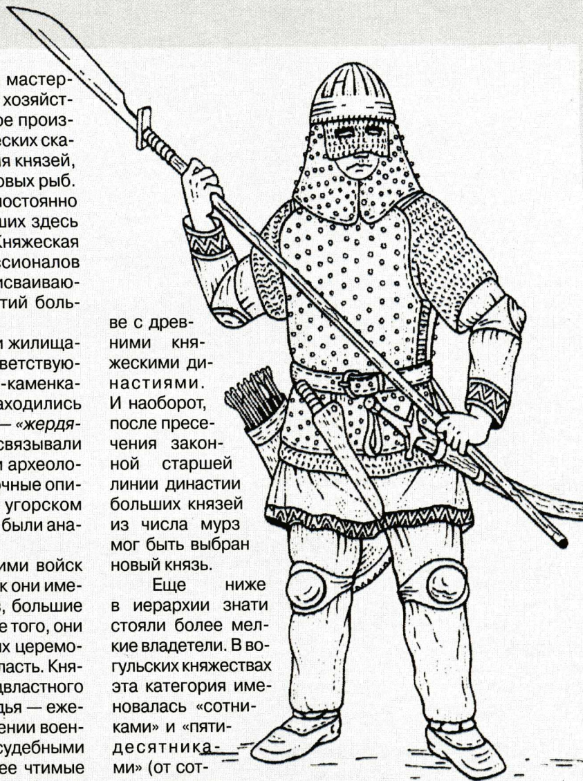
Остяцкий воин конца XVI — начала XVII в. (Реконструкция выполнена по археологическим находкам и музейным экспонатам).

Основную массу населения угорских княжеств составляли свободные люди, проживавшие в поселениях-юртах. Среди них выделялись две категории, различавшиеся по месту тех или иных общин в политической структуре княжества. Большую часть составляли общинники из юртов, находившихся в политическом ядре объединения — на территории малого княжества, династия которого возглавила объединение, или на территории добровольно к нему присоединившихся княжеств. Главной повинностью этих общинников была военная служба, поэтому в рус-