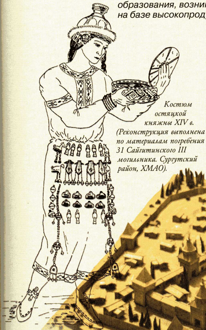
Костюм остяцкой княжны XIV в.

Если в раннем железном веке соотношение укрепленных (городище) и неукрепленных поселений примерно одинаково, то уже в 1-м тысячелетии н. э. абсолютное большинство таежного населения жило на городищах. Когда по истечении определенного времени — около 30 лет — деревянные укрепления и жилые постройки приходили в негодность, а в ближайшей округе иссякали запасы леса для дров, то крепости просто-напросто забрасывались. Новые укрепленные поселки возводились неподалеку, иногда всего в нескольких сотнях метров от заброшенных.